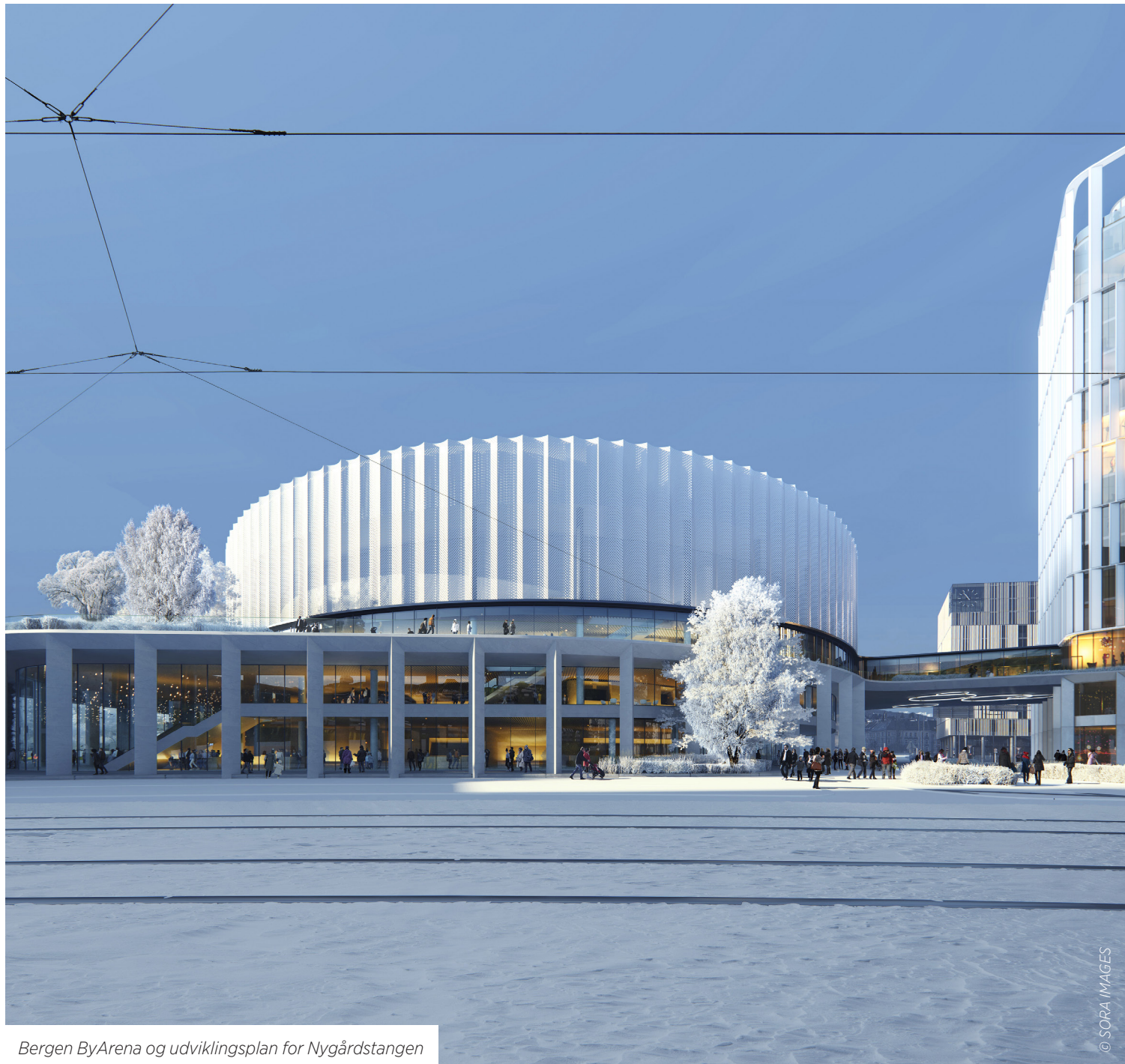
Bergen ByArena og udviklingsplan for Nygårdstangen