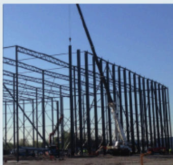
Effektive kvadratmeter LOGISTIKCENTRE