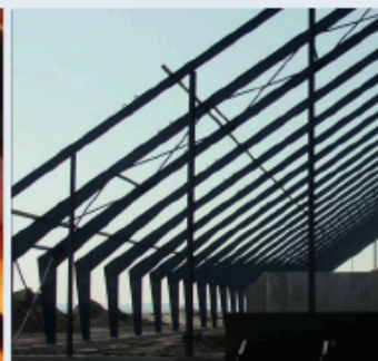
Monumental styrke INDUSTRI & LANDBRUG