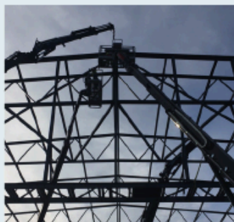
Sikkerhed i detaljen DATA CENTRE

CSK Stålinindustri A/S | Industrivej 7 | 7700 Thisted | CVR-nr: 20216883