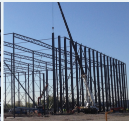
Effektive kvadratmeter LOGISTIK CENTRE