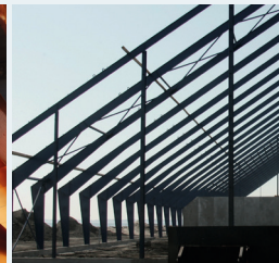
Monumental styrke INDUSTRI & LANDBRUG