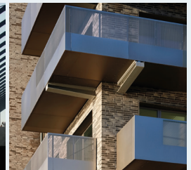
Totalløsninger til nybyg ALTANER