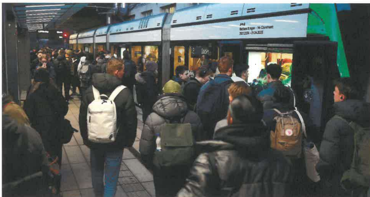
Under Barbara Krugers besøg i Aarhus, havde hun et ønske om, at hendes kunstudstilling "No Comment" skulle folieres på letbanetogene.

I forbindelse med en stor særudstilling har vi indgået et samarbejde med ARoS Kunstmuseum om at udsmykke 2-3 letbanetog. Den anerkendte internationale kunster Barbara Kruger har påbegyndt designet af kunstværket, der bliver en fuldfoliering. Letbanetogene og udstillingen på ARoS vil være offentlig tilgængelig i perioden november 2024 til april 2025.