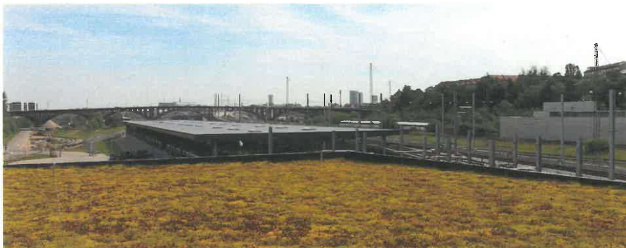
Aarhus Letbane er eldrevet og en vigtig del af Aarhus Kommunes målsætning om at gøre byen CO 2 -neutral i 2030.

Letbanetogene kører fra kl. 4.30 om morgenen til godt midnat hver dag. Kun om natten samles de i Trafik- og Servicecentret, hvor de serviceres, rengøres og repareres, hvis det er nødvendigt.