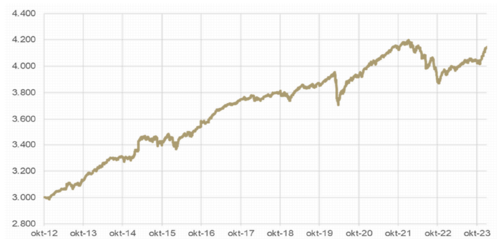
Figur 1: Daglig indre værdi for Investeringselskabet Artha Safe A/S fra oktober 2012.

Selskabets indre værdi pr. aktie blev i 2023 øget fra 3.944 kr. primo til 4.148 kr. ultimo 2023 svarende til en stigning på 5,16 %.