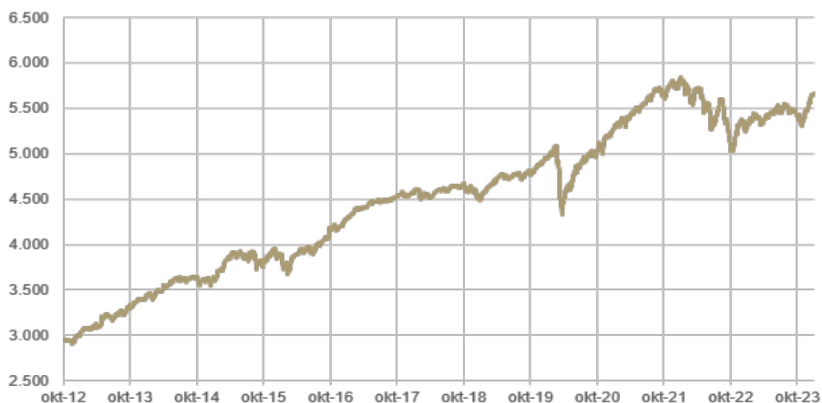
Figur 1: Daglig indre værdi for Investeringselskabet Artha Optimum A/S fra oktober 2012.

Selskabets indre værdi pr. aktie blev i 2023 øget fra 5.279 kr. primo til 5.662 kr. ultimo året svarende til en stigning på 7,3 %.