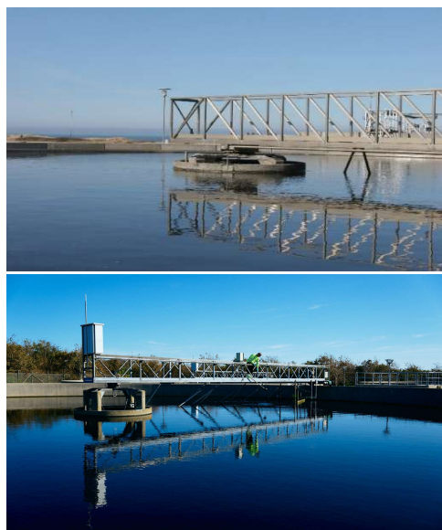
Foto fra Hanstholm Renseanlæg og Thisted Renseanlæg

Thy Forsyning er i løbende dialog med Thisted Kommune vedrørende spildevandskloakering og specielt separatkloakering, hvor der løbende kan ske ændringer og tillæg til den eksisterende spildevandsplan, som bl.a. sker ifm. fremskyndning af planlagte separeringsprojekter, hvor fremskyndelsen kan ske pba. økonomiske- og miljømæssige gevinster. Læs mere på vores hjemmeside: