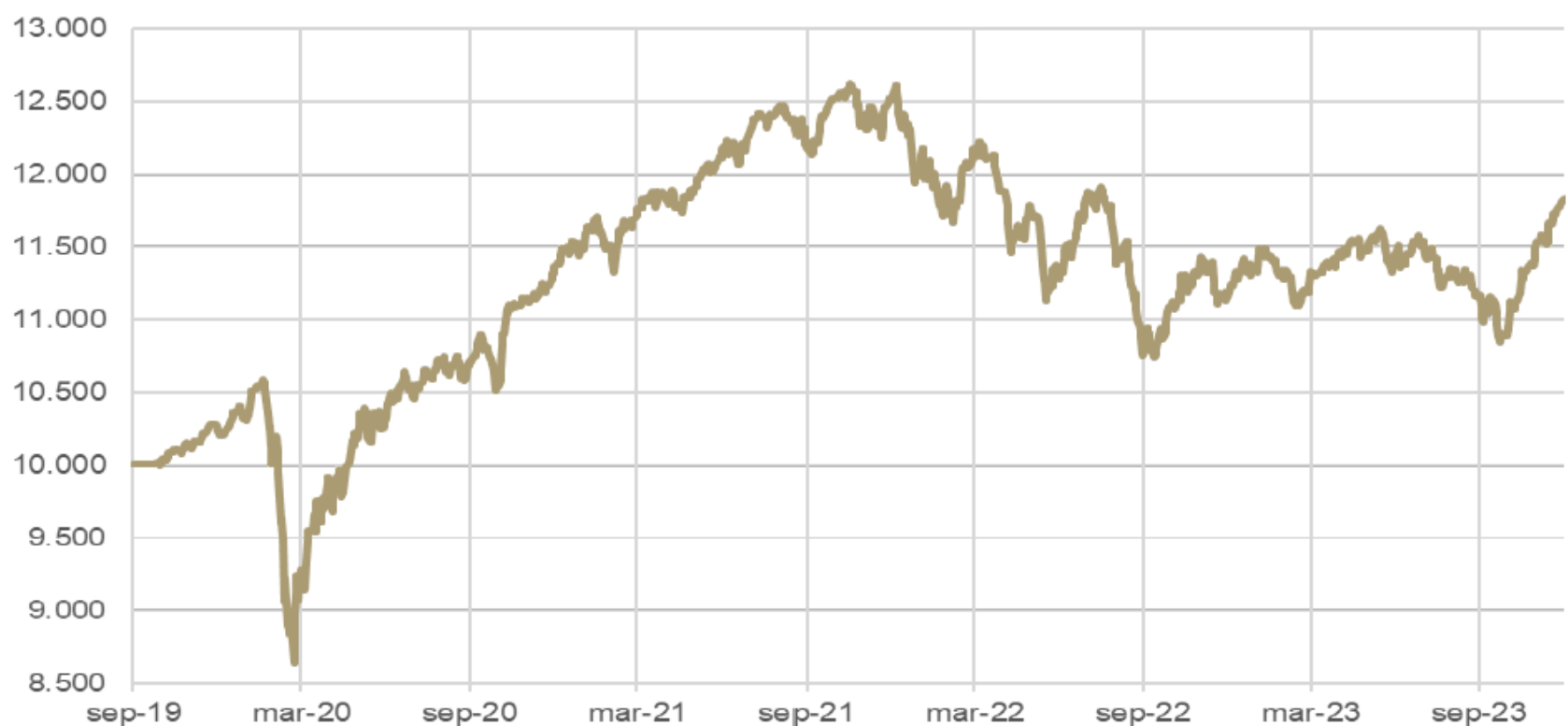
Figur 1: Daglig indre værdi for Investeringselskabet Artha Responsible A/S fra oktober 2019.

Selskabets indre værdi pr. aktie blev i 2023 øget fra 11.153 kr. primo til 11.833 kr. ultimo svarende til en stigning på 6,1 %. Den indre værdi opgøres dagligt som led i selskabets risikostyring samt til brug for handel i selskabets aktier, jf. nedenfor. Den foreløbige indre værdi ultimo 2023 opgjort i Faktaarket udsendt primo 2024 var 11.833 kr. Der er således god overensstemmelse mellem den daglige opgørelse og den reviderede opgørelse pr. ultimo 2023, idet disse er identiske.