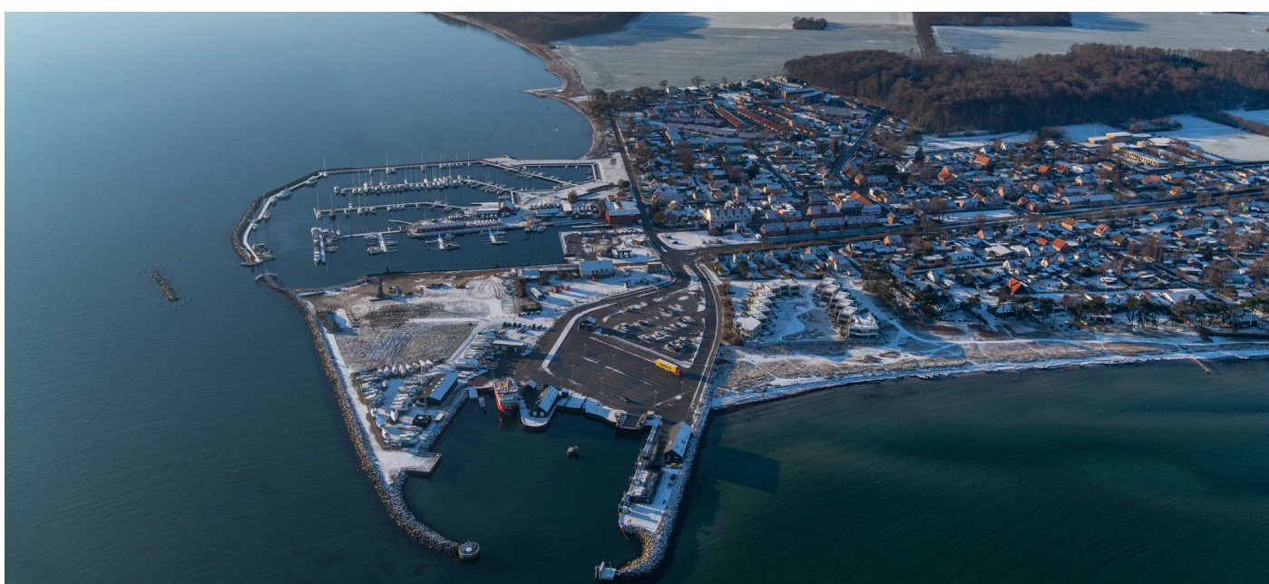
Færgebyen i Hou