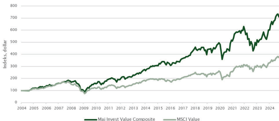
Afkast for valuestrategien i forhold til MSCI World Value-indekset

Maj Invests value-strategi har siden 2004 leveret et markant højere afkast end MSCI World Value-indekset. Grafen viser en stabil langsigtet vækst, hvor strategien især siden 2010 har skabt en betydelig merperformance. Selvom afkastet har været mere volatil end MSCI-indekset, har strategien vist sig robust med stærke opsving efter markedsudsving. Den konsekvente merperformance understreger værdien af en disciplineret value-tilgang og aktiv forvaltning.