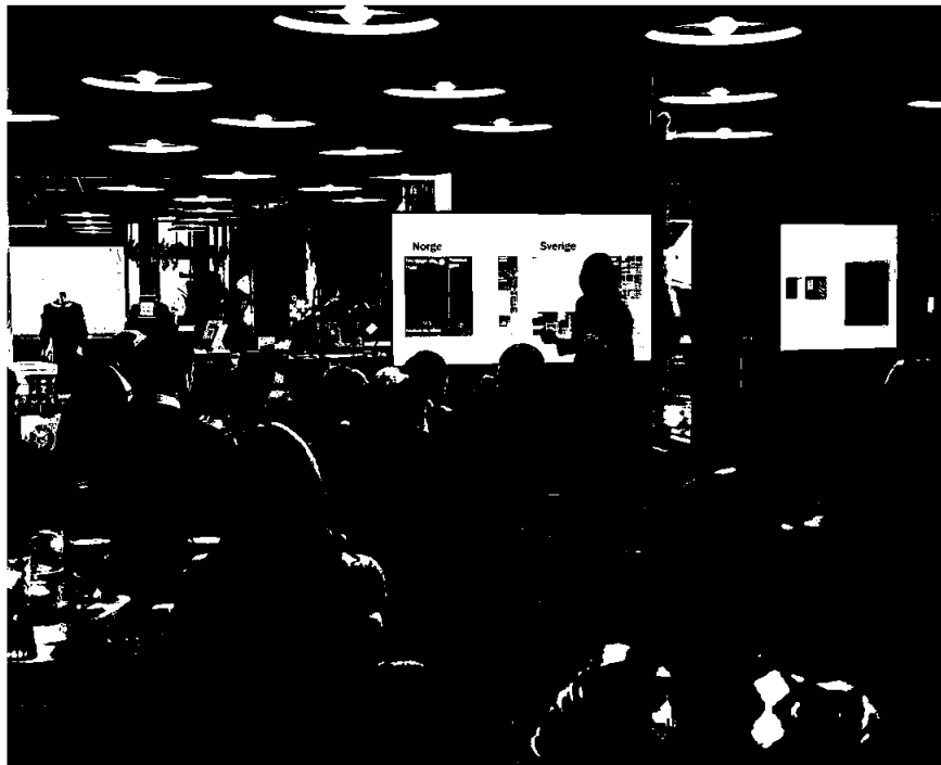
Frokostforedrag på Bærekraftsuken 2024.

Som eiendomsbesitter er Herfo opptatt av å tilby sine leietakere fremtidsrettede og miljøorienterte lokaler. Dette gjøres ved å redusere belastningen på klima og miljø gjennom konkrete tiltak i byggene, tiltak og løsninger for energieffektivisering og smart energibruk, samt gjennom god løpende eiendomsforvaltning. Videre tilbyr vi arrangementer og tiltak som setter bærekraft på agendaen. Som et eksempel, gjennomførte vi for første gang «Bærekraftsuken» i Vingtor Arbeidsbar i november 2024. Gjennom en hel uke ble det holdt foredrag og workshops med bærekraft som hovedtema.