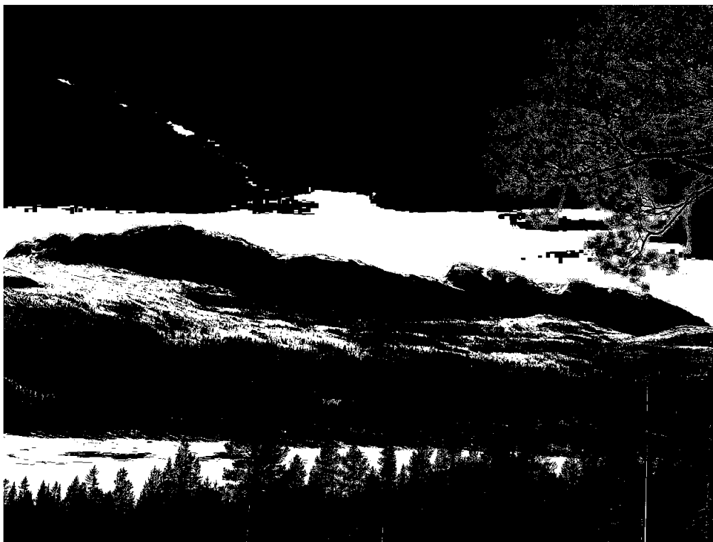
Utsikt fra tomtene i Solskinnsmarka

Balanseført verdi av avtalen og prosjektet var 455 000 kroner ved årsskiftet.