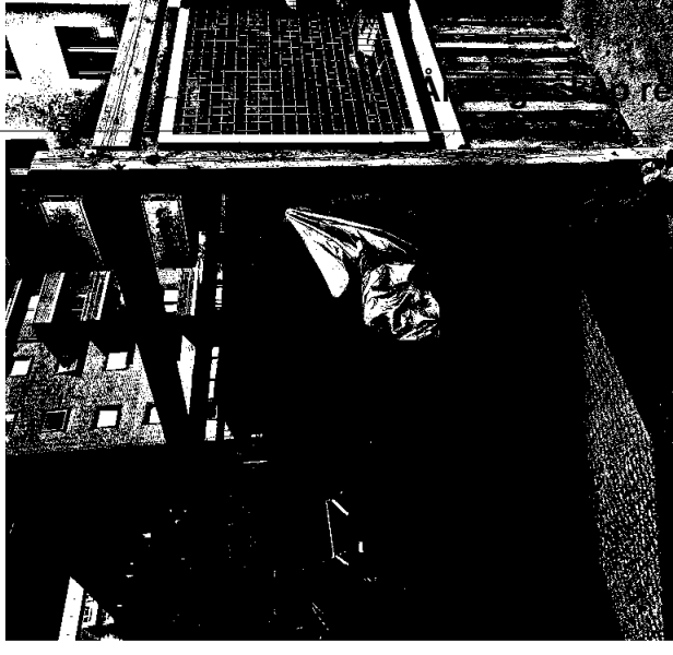
Nåværende konstruksjon (gammelt tørkestativ)