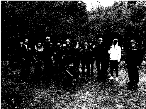
Bilete: Kvam bibliotek

løpet av året, har me blant anna gått turar i nærområdet, spela spel, lese bøker og eventyr, sett på film, og baka julekaker. I oktober var Språktreff med på KvammaVEKO sitt arrangement Trakk & Snakk, der fleire av deltakarane uttrykte at det var stas å ha fått snakka med ordføraren. Før jul, fekk me med oss to frivillige frå Øystese Bygdekvinnelag som var med på bagedag på Gamleskolen, der me fekk prøva oss på å laga krumkaker, kakemenn, sjokoladekjeks, og peparkakehus.