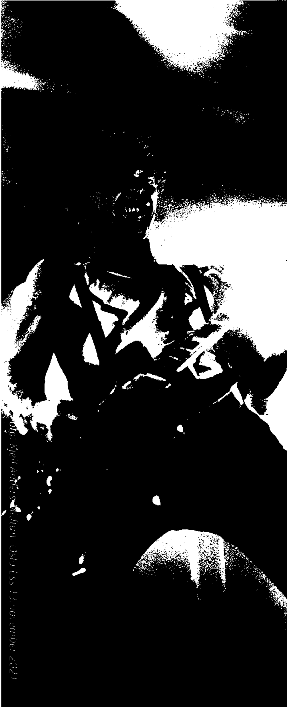
Oslo Ess 13. november 2021