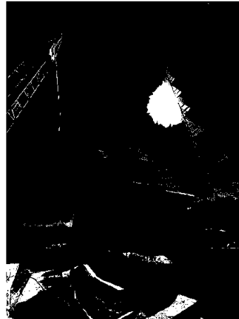
Innseilingen boligprosjekt, Fredrikstad kommune