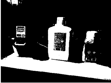
(Nye produkt 2024/2025)

Som underleverandør er en svært sårbar i forhold til konjunkturedringer, dette krever rask omstilling. Vi ser at vi leverer tjenester med meget god kvalitet, noe som også blir viktig fremover. Samt å se på mulighet for nye oppdrag, her har vi forespørsler om nye oppdrag både fra nye og eksisterende kunder.