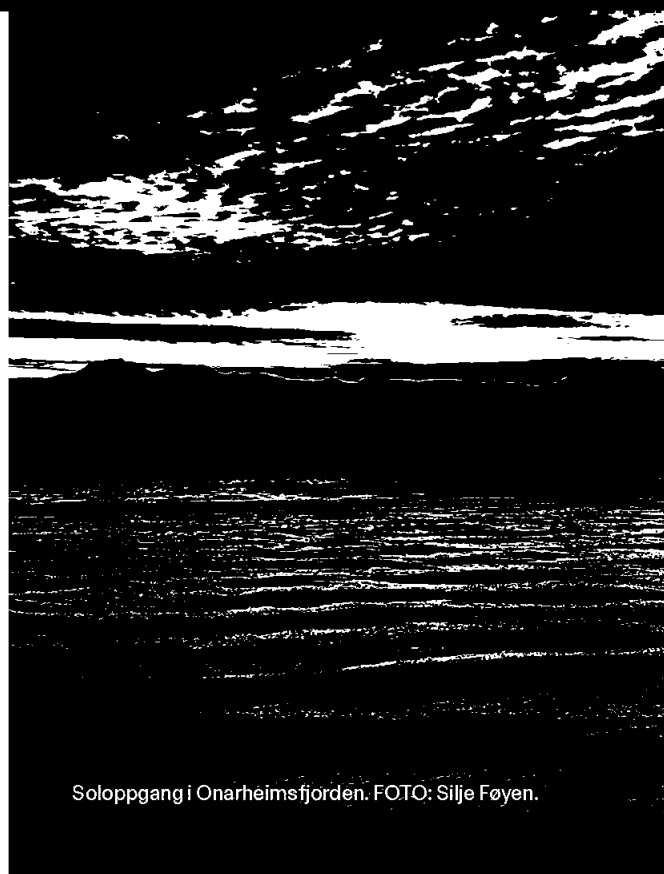
Soloppgang i Onarheimsfjorden.