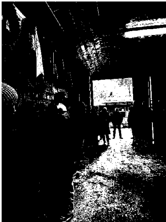
Besøk hos Kjetil Helgestad