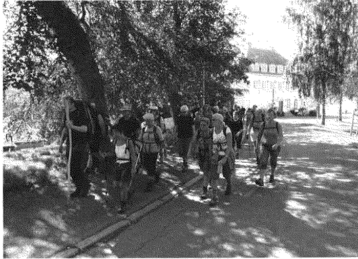
Langvandringen nærmer seg målet, 28. juli 2011.