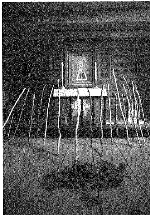
Vandring med 10 åringer til Bjølstadkapellet i Heidal.

Styret mener senteret er inne i en spennende utvikling på Hjerkinns og på strekningen Sel - Skaun. Styret ser det som en god løsning å utvikle senteret på Hjerkinns sammen med Norsk Villreinsenter. Styret mener samarbeidet vil styrke pilegrimssenteret på flere områder som kompetanse, informasjon, drift og administrasjon. Det vil gi helt andre muligheter for etablering av utstillinger og gjennomføring av arrangement. Styret ser det som en klar utfordring å skaffe nødvendige økonomiske midler til en slik etablering. Styret er samtidig bevisst på at ressursbruken ved senteret skal være slik at både strekningen og stedet ivaretas på en god måte.