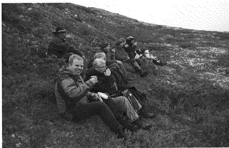
Vandring på Dovrefjell med kirkelig stab og råd i Dovre.

Styret mener senteret har etablert gode samarbeidsrelasjoner til mange og ulike aktører innen virksomhetsfeltet. Disse relasjonene må styrkes og videreutvikles.