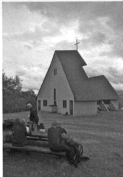
Vandring med innsatte Hamar kretsfengsel.

Styret vil understreke behovet for kompetanse innen pilegrimfeltet. Dette bør skje gjennom et bredt samarbeid med mange og ulike miljøer, både lokalt, regionalt og nasjonalt. Her kan Pilegrimssenter Dovrefjell spille en viktig rolle i utviklingen videre.