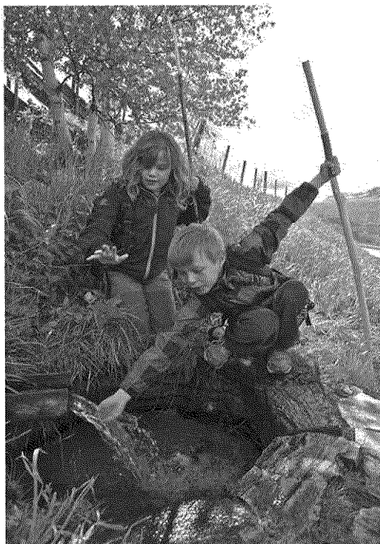
Vandring med 3. klasse Dovre skole. Olavskilden.

Pilegrimssenter Dovrefjell har i 2011 arrangert eller vært medarrangør for ni pilgrimsvandring . Tre av disse er vandringer over flere dager, den lengste er langvandringen hvor Pilegrimssenter Dovrefjell har ansvaret for 20 dager. Disse vandringene har hatt om lag 550 deltakere, og tar vi med skole og menighetsvandringene er deltakerantallet i 2011 730 vandrere. (For dokumentasjon og en bredere presentasjon av tallmaterialet for 2011 – se vedlegg til årsberetningen; Rapport for vandrings sesongen 2011.)