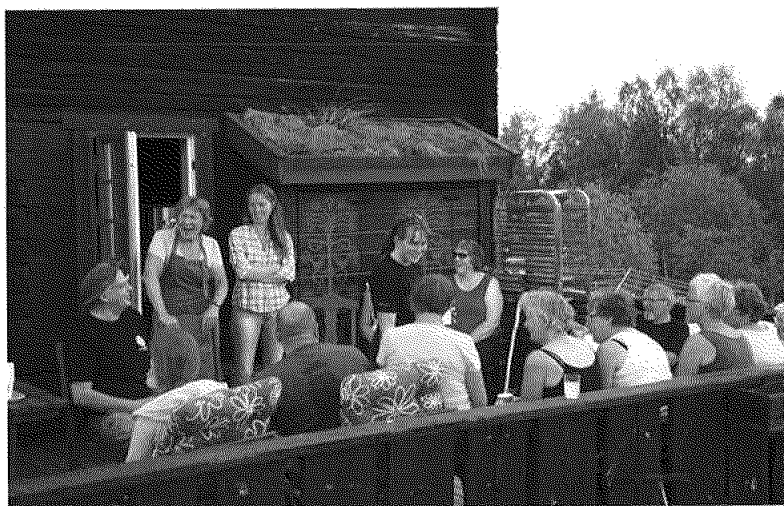
Pinsevandring med Rennebu menighet, besøk på overnattingsstedet Langklopp.

Det har vært avholdt 5 styremøter i 2011.