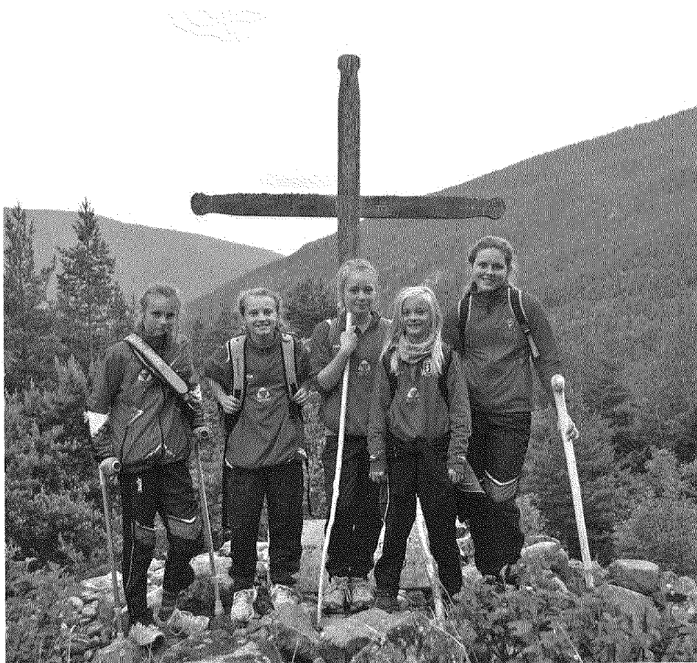
6. klasse Sel skole, vandring i Rosten.