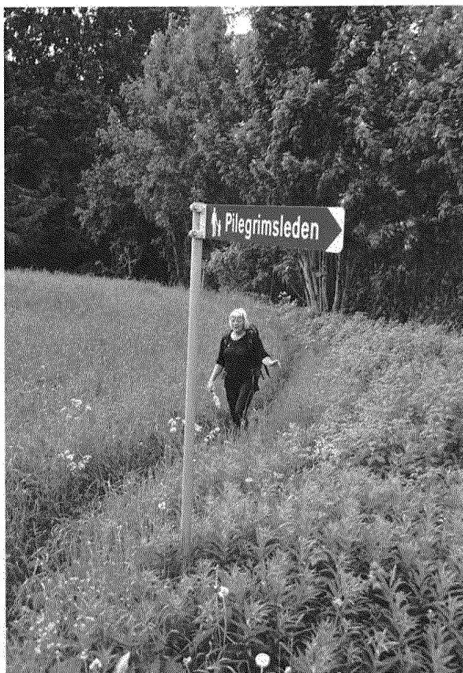
Kristinvandring fra Skaun til Trondheim. Skiltning.

ideen om en partnerskapsavtale er god og oppfordrer Sør-Trøndelag fylkeskommune til å vurdere innføring av slike eller tilsvarende avtaler.