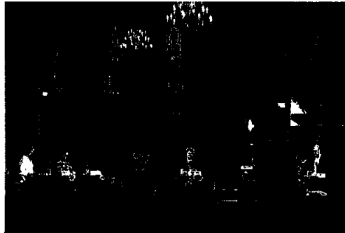
Fredag 21. august inviterte Fafo til en samtale i Grønland kirke mellom forskere, statsminister og Høyreleder Erna Solberg og Arbeiderpartileder Jonas Gahr Støre. Temaet var «Norge ut av koronakrisa».

Allmennrettet formidling er viktig for instituttet. I 2020 ble det arrangert 18 faglige seminarer og arrangementer på Fafo. Koronasituasjonen førte til avlysning av Arendalsuka og Fafofesten. Vi arrangerte imidlertid Fafofestens faglige forspill med statsminister Erna Sol-