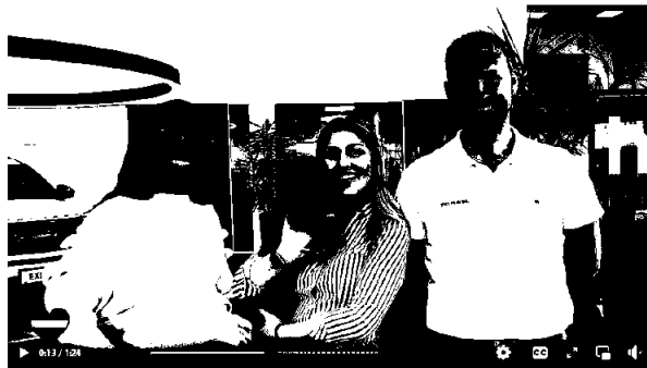
Happy Pride! For mangfold og kjærligheten <3

Ledelsen jobber for å bedre kjønnsbalansen i selskapet, men møter utfordringer ved få kvinnelige søkere. Over mange år har ledelsen jobbet med en bevisstgjøring av at bildebruk og ordvalg kan ha betydning for hvem som søker jobb hos oss. Ved profilering av selskapet skal mangfoldet som faktisk utgjør selskapet komme godt frem, både med hensyn til kjønn, variasjon i alder og nasjonalitet. Eksempler på dette er markedsfilm produsert i forbindelse med Pride i juni 2021, samt julehilsen fra selskapet samme år. Det har vært god oppslutning rundt begge filmene, og første film underbygger særlig at det er åpenhet og inkludering knyttet til mangfold i selskapet.