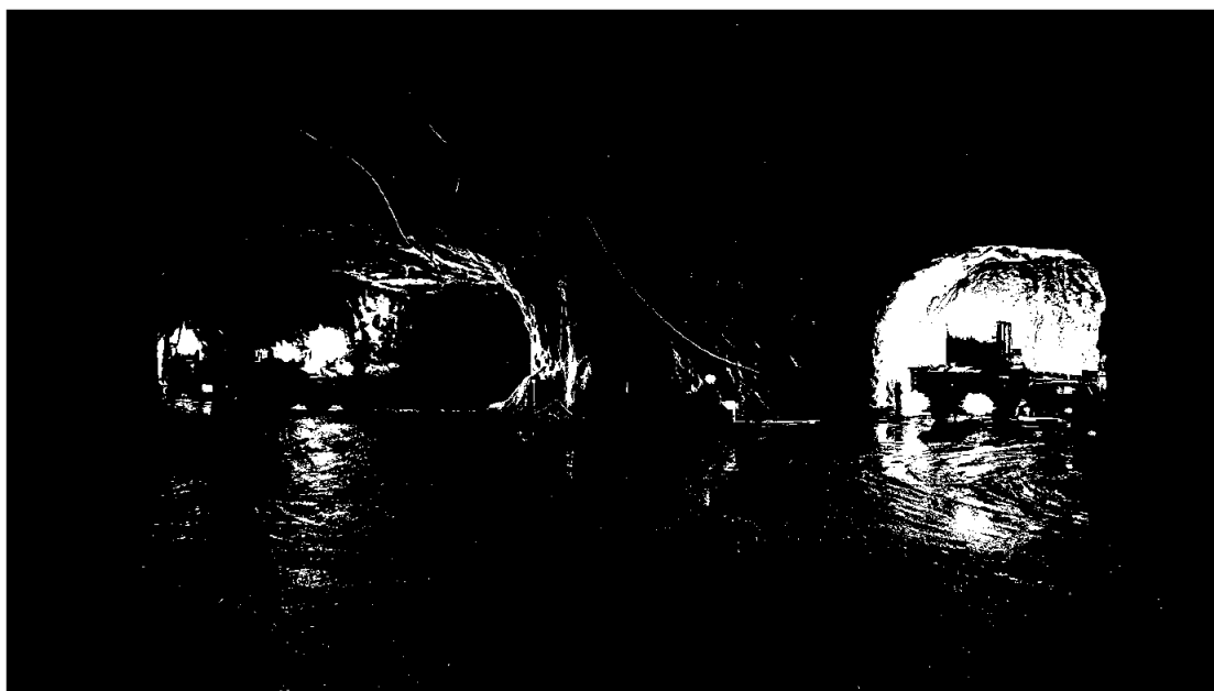
LNS AS – Andfjord Salmon Tunneler

Etter balansedagen har konsernet solgt deler av sin aksjepost i Rana Gruber ASA og eier nå under 10% av selskapet. En del av salgsprovenyet er benyttet til refinansiering av konsernets gjeld, samt til øvrige generelle formål innen konsernet.