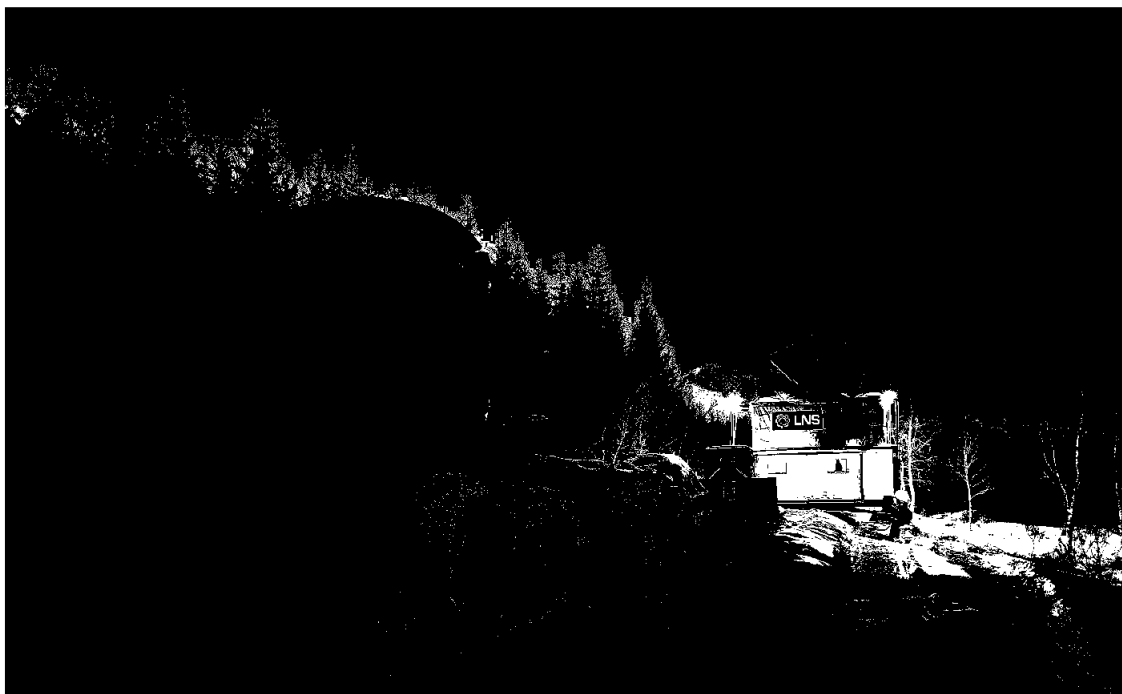
LNS AS kjerneborer i Vesterålen for Arctic Graphite AS

LNSH AS har ingen ansatte. Av styrets syv medlemmer er det tre kvinner. Konsernet har som policy at det ikke skal forekomme forskjellsbehandling grunnet kjønn, etnisitet, religion, alder eller på annen måte.