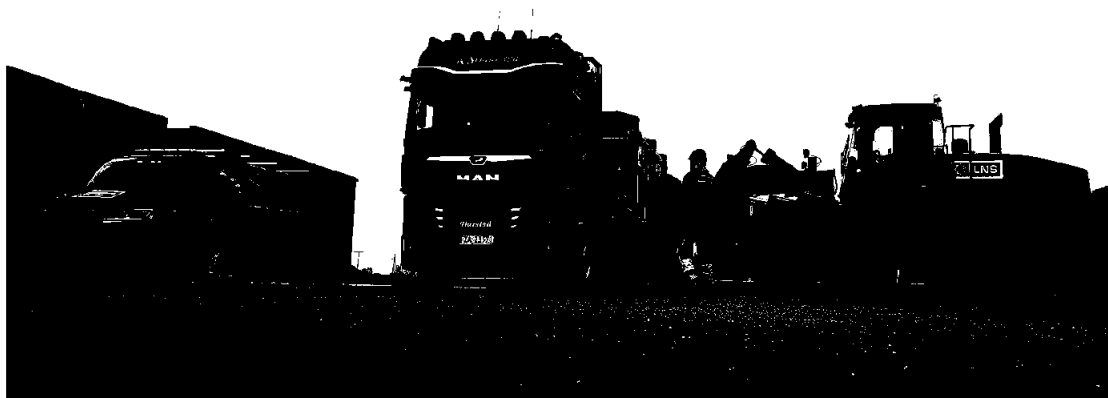
Hålogaland Element laster leilighetsmoduler for utskipning til LNS Spitsbergen

Styret presiserer at det er betydelig usikkerhet knyttet til vurderinger av fremtidige forhold.