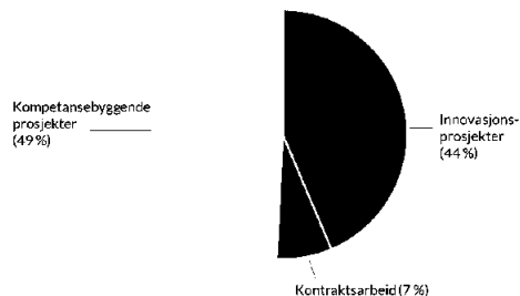
Figur 1. Fordeling av omsetning på ulike prosjektkategorier og kontraktsarbeid, 2023

En vesentlig del av RISE PFIs virksomhet er langsiktige forskningsprosjekter med industriell og offentlig finansiering (fordelt på kompetansebyggende prosjekter (49 %) og innovasjonsprosjekter for næringsliv (44 %), se figur 1 nedenfor). Den langsiktige forskningen omfattet i alt 27 flerårige prosjekter (2022: 29). Prosjektene fordelte seg på RISE PFIs fokusområder bioraffinering og bioenergi, fiberteknologi og fiberbaserte produkter, samt biopolymerer og biokompositter (se figur 2 nedenfor). Andelen kontraktsarbeid var i 2023 på 7 %.