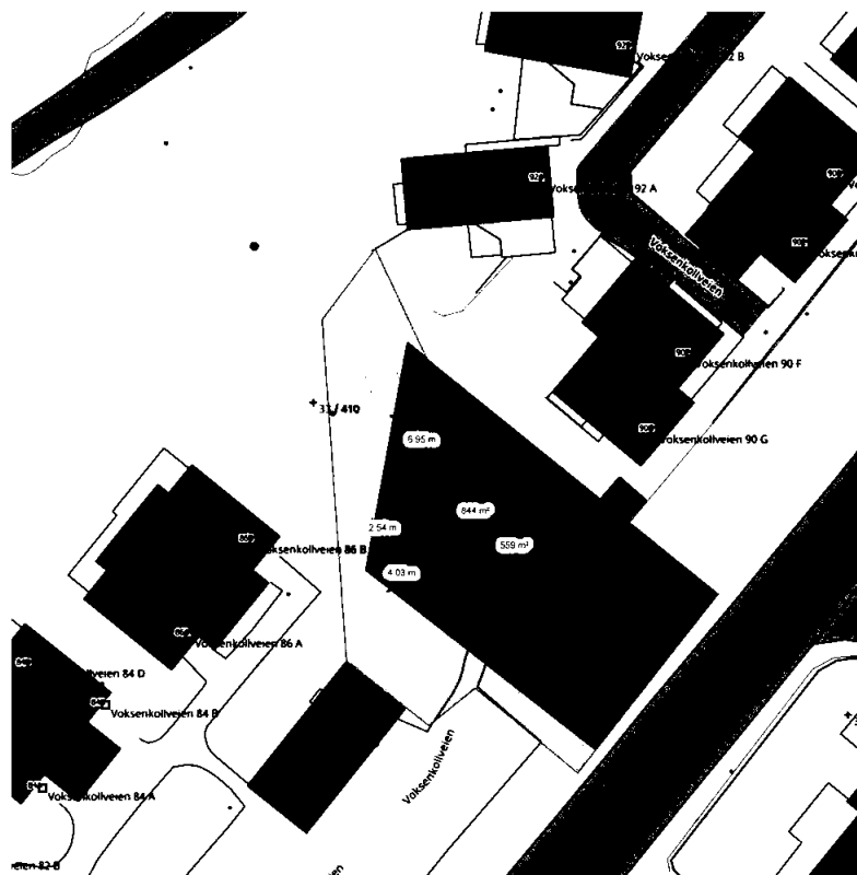
Figur: Skisser av areal rundt seksjon 13. Oransje: Illustrasjon av areal tilsvarende 13%BYA, her 844m 2 . Grønt: Dagens tilleggsareal til seksjon 13 med mål fra tegning, her 559m 2 .

For å oppnå 849m 2 trenger seksjon 13 altså i størrelsesorden 280m 2 fra fellesareal i Sameiet, og frasier seg på samme tid rett på fellesareal tilsvarende seksjonens andel.