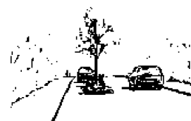
Bilde fra V128.

Øyen kan beplantes. Bør vurderes særskilt med tanke på vedlikeholdskostnader.