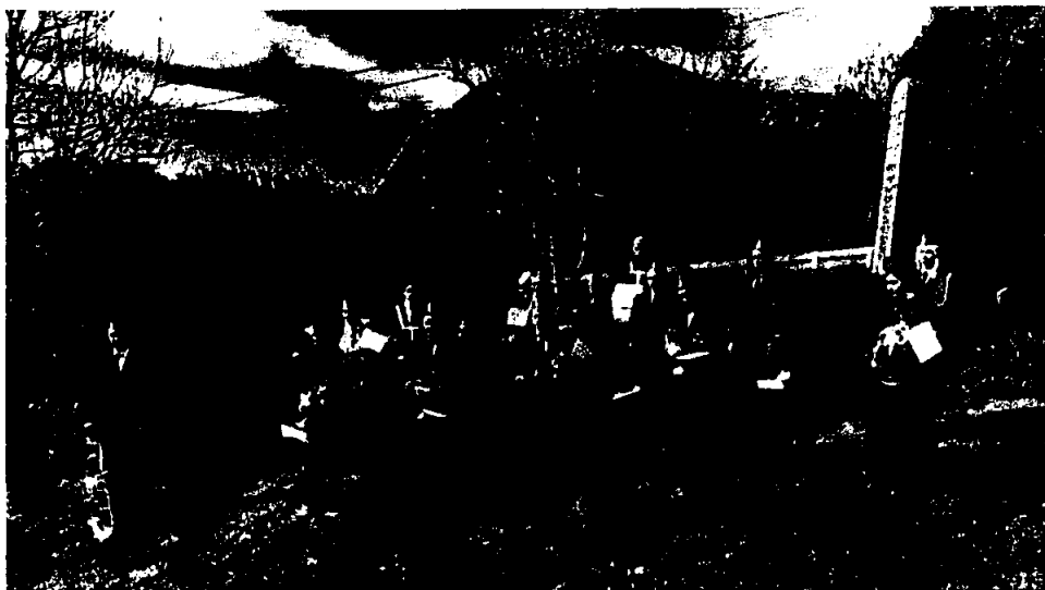
Speling ved minnestøtta 8.mai 2020 – 75 års markering