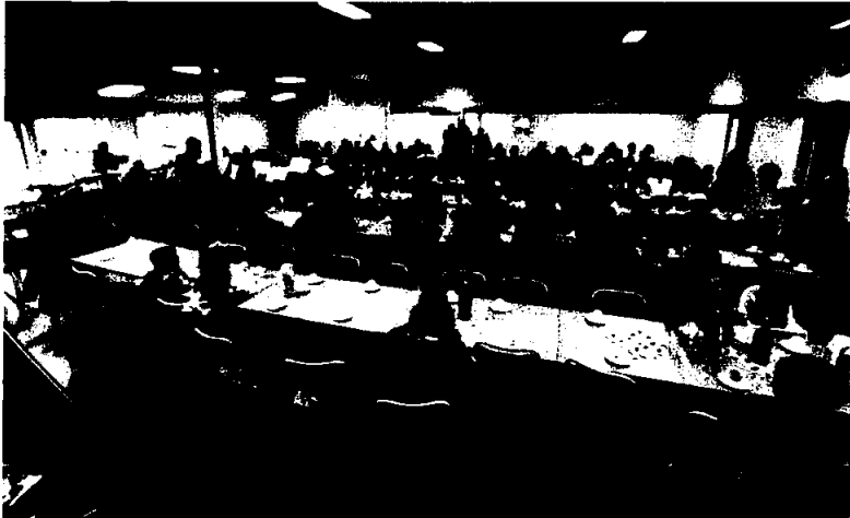
“Før Koronaen” – siste sprell i grendahuset før nedstenging – konsert og basar i februar 2020