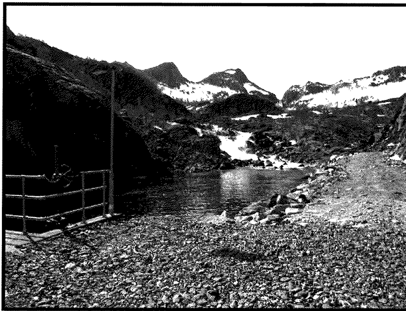
Området rundt demningen.

Enda gjenstår det en del oppryddings-/ planeringsarbeid nede ved stasjonen, som vil bli vurdert tatt 2019/2020.