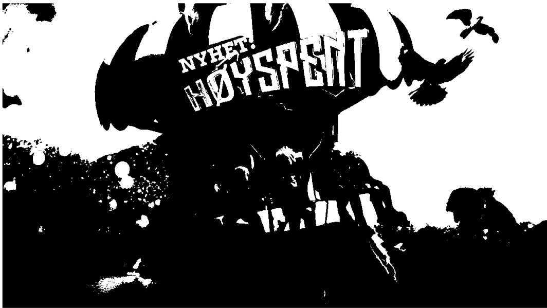
Høyspent - ny attraksjon utenfor Energisenteret sommeren 2025.

Etter avslutningen av sommersesongen startet Hunderfossen Eventyrpark, sammen med Energisenteret, en revitalisering av uteområdet på plassen foran Energisenteret. Dette innebærer både utbedringer av grunnforholdene, reasfaltering og etablering av nye grønne publikumsområder. I tillegg investeres det i en ny og betydelig attraksjon rett foran Energisenteret som har fått navnet «Høyspent». Det dreier seg om et 27 meter høyt tårn hvor gjestene får oppleve både fantastisk utsikt og «magekil» på vei opp og ned. Det er Eventyrparken som står for investeringene, men Energisenteret skal bemanne Høyspent i parkens sommersesonger, inkludert høstferien. I tillegg skal Energisenteret bygge og bekoste to vente-aktiviteter i køsonen for Høyspent. Den nye attraksjonen blir utformet som en høyspentmast i toppen, og det skal henvises til Energimontøren inne i Energisenteret fra nevnte køsoner.