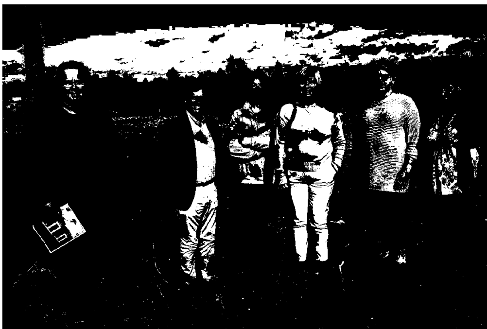
Bilde: Styret i Arendal Boligbyggelag på befaring på Tybakktoppen.