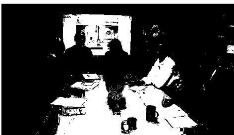
Bilde: Ansatte i gang med planlegging av generalforsamlinger.

Boligbyggelaget forvalter i dag 4618 boliger fordelt på borettslag, garasjelag, sameier og stiftelser. Vi forvalter nå flere sameieboliger enn borettslagsboliger.