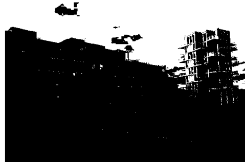
Bilde: Bryggebyen. Nytt sameie til forvaltning.

Boligbyggelaget yter også en del tilleggstjenester for boligselskapene, herunder juridiske tjenester i samarbeid med Norske Boligbyggelag.