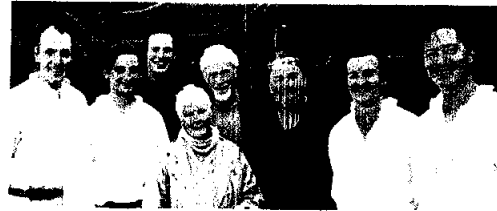
The Patron Judi Dench together with The Festival Players Theatre Company.

En del av kompensasjonsmidlene er avsatt til gjennomføring av arrangementene flyttet fra 2020 til 2021.