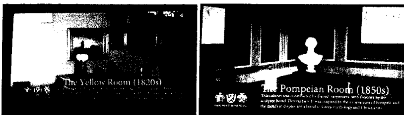
Museet kunne i 2020 tilby digital omvisning fra saler og rom på Rosendal Slott i form av 11 videoinnstallasjoner laget av Magnus Lysbakken og vist på skjermene i Riddersalen.