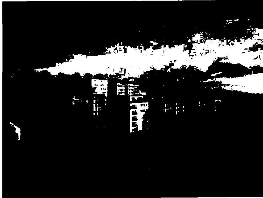
Atelierhagen i Asker

Prosjektet er et samarbeidsprosjekt mellom Backe Prosjekt AS og ABBL og inneholder 117 leiligheter, skulpturpark og kunstnerbolig med atelier. Prosjektet er gjennom kommunen lagt til offentlig høring og det forventes førstegangsbehandling av reguleringen i løpet av høsten 2023.