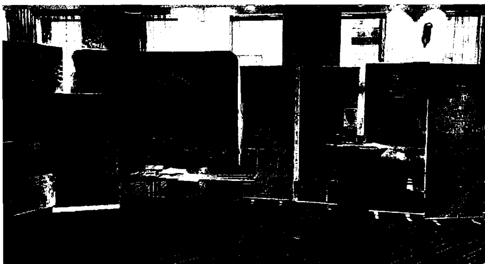
Standen på jobbmessa «Bli med heim» i Oslo 13. april 2023