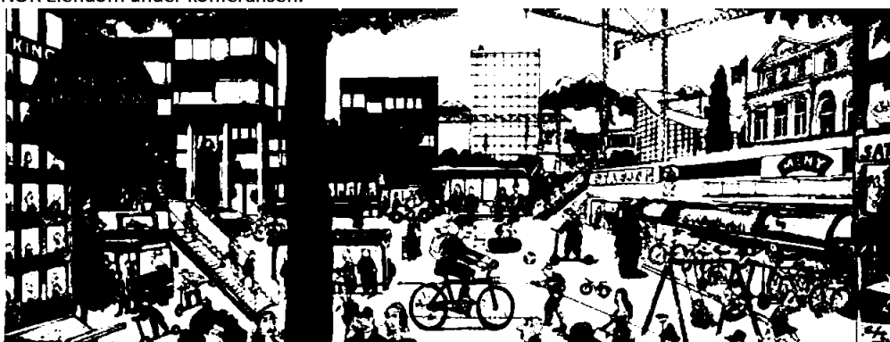
«Nok folk + Kollektivtilbud = God sentrumsutvikling?» var tittelen på konferansen.