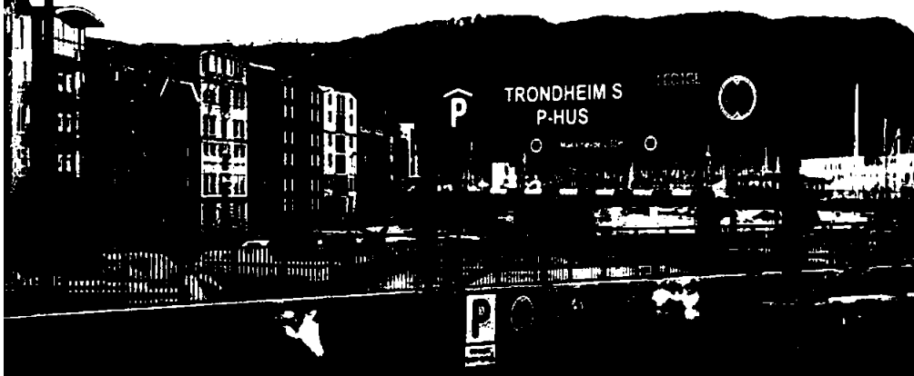
Trondheim S P-hus tilbyr parkering for 210 biler, hvorav 100 plasser med elbillading. Bygget er under bakken og stod ferdig 7. november 2022.