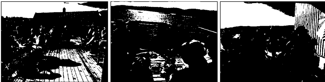
Lunsj på skolens terrasse i 3. etg og avreise til Jomfruland med båt.

Årsmøtet for Forumet/Kunstskolene avholdes i Kragerø mai 2022 med et omfattende « Bli glad i Kragerø »-program.