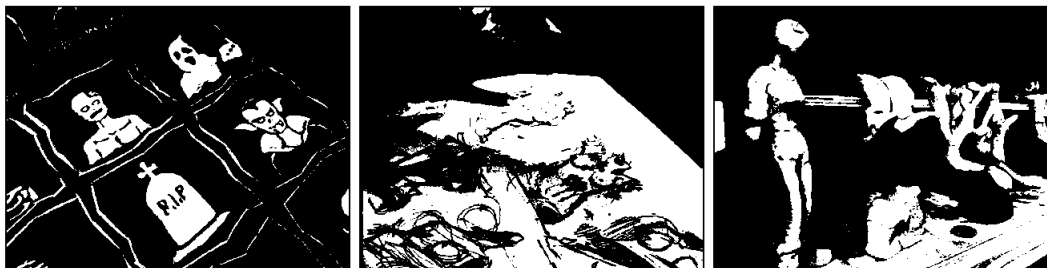
Romlig tresnitt, skisse og raske leire-croquis.

Grunnet Covid-situasjonen startet KKS arbeidet med å presentere skolen bedre gjennom digitale medier. Skolen har kjøpt inn enkelt utstyr som et GoPro-kamera, -gimball og mikrofon som vi bruker for å høyne kvaliteten på filmene vi legger ut på sosiale medier. KKS holdt sin første digitale åpne dag på Zoom 24. mars 2021. Dette var en viktig oppstart på bruk av video og involvering av studenter i markedsføringen. Film fra den åpne dagen kan sees på skolens hjemmeside: https://kragerokunsthøgskole.no/digital_dag/ .