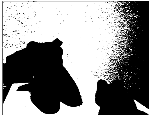
Akt, croquis og fantasi-studier.

Vi utvikler to filmprosjekt parallelt ved skolen. Det første prosjektet er å lage timelapse-filmer fra undervisningen. Det andre prosjektet er å lage en liten filmserie som viser de forskjellige fagene ved skolen. I disse filmene viser vi arbeidssituasjoner fra undervisningen, korte intervju med studentene og lærere og, i åpningssekvensen, en dronefilm som viser skolens fantastiske beliggenhet filmet fra sjøen flyvende inn over Gunnarsholmen. Filmene er et samarbeid med en ungdomsbedrift fra Medie- og Kommunikasjon på Hjalmar Johansens VGS i Skien. Dronefilmen er levert av Fokus Foto i Kragerø. Skolen har som mål å bruke Kragerø og skjærgården rundt som en viktig del av markedsføringen, sammen med det unike undervisningstilbudet ved KKS.