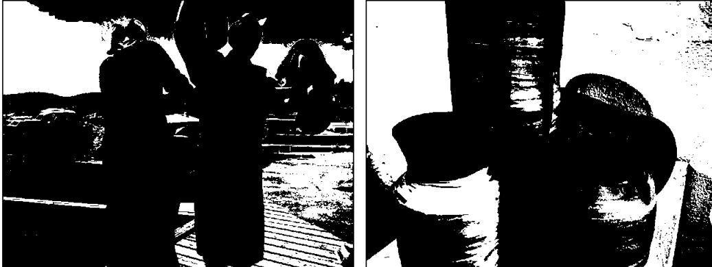
Fra selvstendig fordypningsperiode i 2.kl. Tekstil. Keramikk med glasur og smedarbeid.