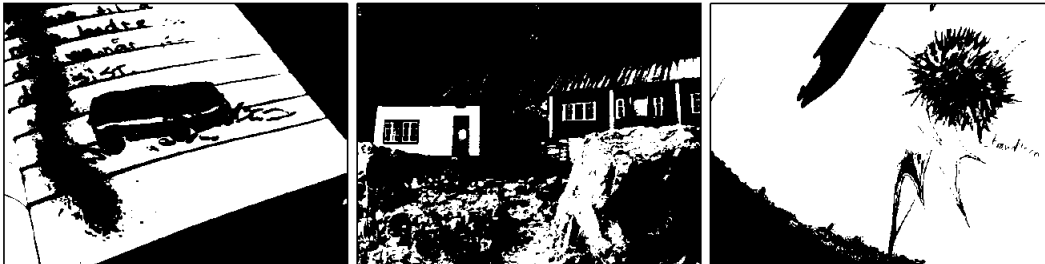
Studentskisser og foto fra studieturen langs Sørlandetskysten,