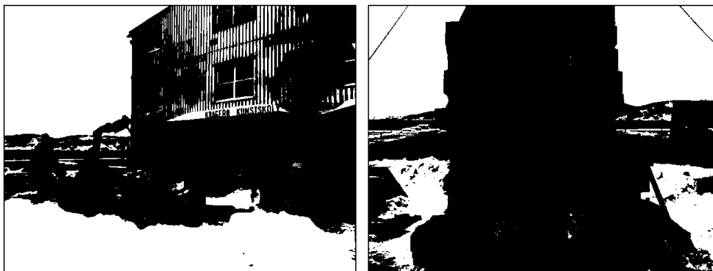
Vedfyring av keramikk i egenbygd ovn. Ved av paller og trevirke fra containere.

Skolen har solcellepanel på taket som et ledd i et kommunalt prosjekt. Solcellepanelet på kunstscolen henter inn gjennomsnittlig 21 569 KWH årlig. Mest hentes inn i mai, juni, juli og august. I tre av disse månedene, blir denne strømmen solgt på spotmarkedet og skolen må kjøpe den inn igjen på høsten og vinteren til en langt høyere pris. Det ideelle ville være at strømmen kunne magasineres via en batteripakke. Batteripakken måtte være «usannsynlig» stor og vil kreve sikring, ventilasjon og romkapasitet. Skolen solgte strøm i 2020 for litt over 700 kr. Skolen er veldig fornøyd med strømmen fra solcellene. I 2021 hadde skolen strømutfgifter på 323 297 kroner - en økning på 160 prosent fra året før. Kompensasjonsordninger tilknyttet økte strømkostnader ser ikke ut til å gjelde for vår skole. Styret ser med bekymring på de høye strømprisene som forventes også i 2022.