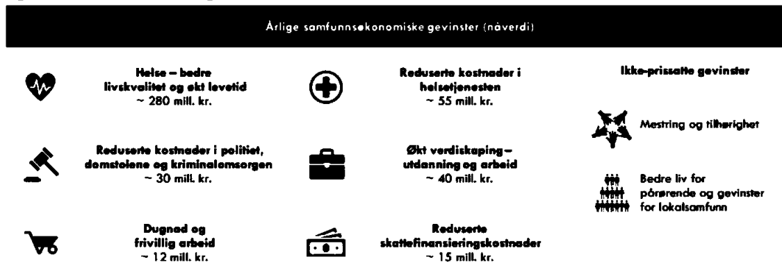
Figur 1-3: Samfunnsøkonomiske gevinster

Notat: Anslag utarbeidet av Oslo Economics