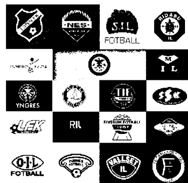
Våre 18 samarbeidsklubber i 2024

HamKam ønsker å være hele Innlandet sitt lag og skal i samarbeid med Wang Toppidrett Hamar bidra med fotballkompetanse til hele regionen. HamKam hadde 18 samarbeidsavtaler med lokale klubber og ambisjonen er å løfte spiller- og trenerutvikling til et høyere nivå gjennom erfaringsutveksling og kompetanseheving.