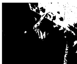
Julefest på Friluftshuset