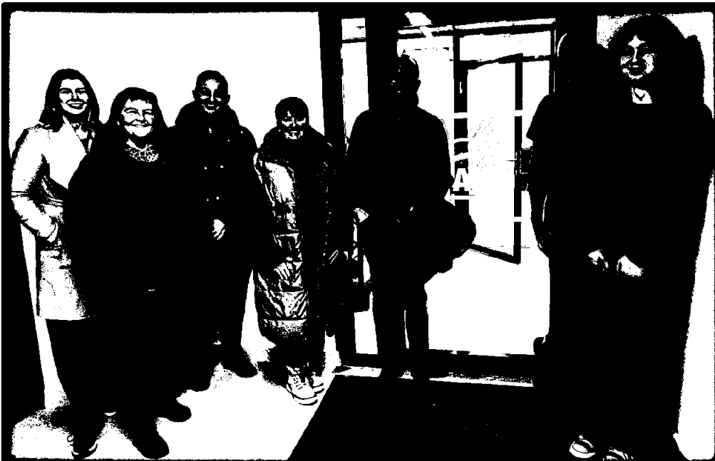
Fra styrets besøk til ATB AS i forbindelse med styremøte i desember.