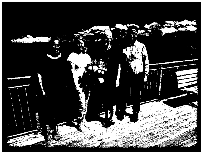
Kastvollen Rehabiliteringssenter AS fikk i 2023 tildelt prisen for «årets lærebedrift».

Pr. 31.12.2023 har OKS Trøndelag SA 115 medlemsbedrifter. I løpet av året har opplæringskontoret fått seks nye medlemsbedrifter. Tre av disse tilhører sør-delen av Trøndelag. Fem medlemsbedrifter har meldt seg ut da de ikke lenger har lærlinger. Erfaringene så langt, er at et stort flertall av utmeldte kommer tilbake som medlemmer når de har tenkt å ta inn lærling igjen.