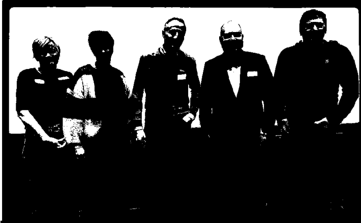
Styret i OKiT, fra konferansen i desember.

Det har vært et godt samarbeid med de andre opplæringskontorene i Trøndelag (OKiT). Nettverket har 33 medlemskontor i Trøndelag. Det har blitt avholdt styremøter og ledermøter i samarbeid med fylkeskommunen gjennom hele året. Daglig leder i OKS Trøndelag SA ble valgt inn som styreleder i perioden