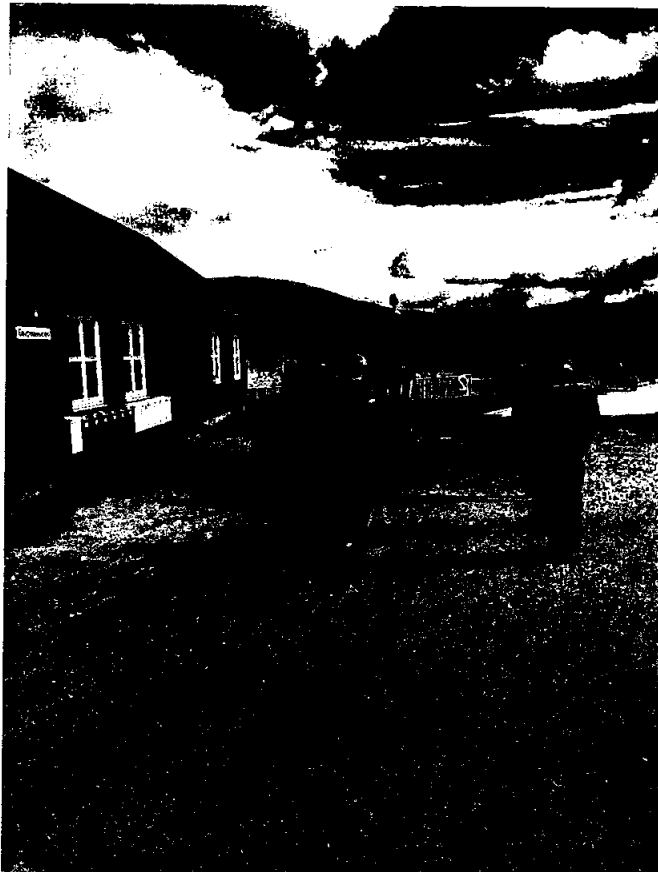
Befaring ved Gaupen kai, Harangsfjorden i Bindal kommune

Årsregnskapet for 2020 er satt opp under forutsetning av fortsatt drift. Det bekreftes herved at forutsetningen om fortsatt drift er til stede. Det har ikke inntruffet andre forhold etter regnskapsårets slutt som har betydning for det framlagte årsregnskapet.