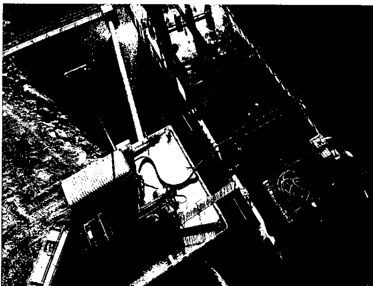
Lamholmen, Nærøysund kommune, lasting fiskeolje

Godsmenge over kaiene til Nord-Trøndelag Havn ble i 2020 totalt 24 430 tonn.