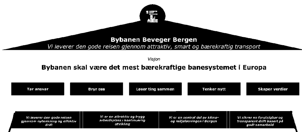
Fig. 1: Strategihuset – Strategisk fundament 2022-2025

Gjennom 2023 er det også gjennomført andre utviklingsprosjekter, i tråd med selskapets strategiske plan, både knyttet til infrastruktur, men også internt i selskapet.