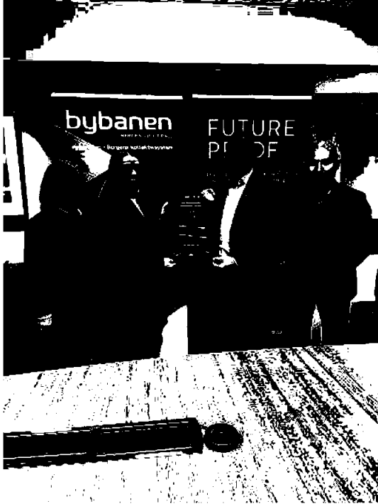
Bilde 1: Signering av Future Proof Plakaten

Åpenhetsloven pålegger blant annet virksomhetene en informasjonsplikt og en plikt til å gjennomføre aktsomhetsvurderinger som skal redegjøres for i en rapport som tilgjengeliggjøres. Redegjørelsen for 2023 blir å finne på Bybanen AS sine hjemmesider, samt som vedlegg til årsrapporten for 2023.