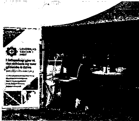
Vibeke og Liv stilte på stand for LiST på Mett Landbruk

Randi Dønne Aas i 80 % stilling fra 01.01. – 30.08. og 60 % stilling fra 01.09. – 30.09. Pensjonist fra 01.10.2024.