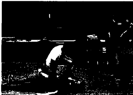
To av LiST sine ansatte under praktiske delen av førstehjelpskurset

Annen hvert år arrangeres det felles avløserkurs for Landbrukstjenestene i Trøndelag. Årets avløserkurs ble arrangert i Namsos 5.og 6.september. LiST stilte med 17 ansatte inkl 2 fra administrasjonen. Tema for kurset var førstehjelp, krisehåndtering og gjennomgang av Lely og Delaval melkekrober. I tillegg til selve kursdelen er det viktig å legge vekt på den sosiale delen av slike kurs.