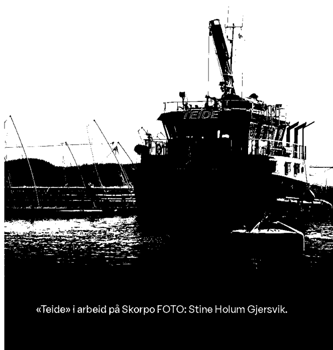
«Teide» i arbeid på Skorpo