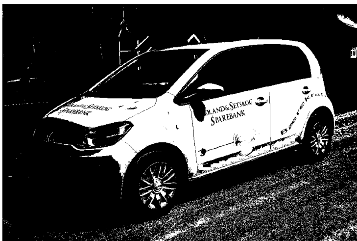
Vår nye el-bil