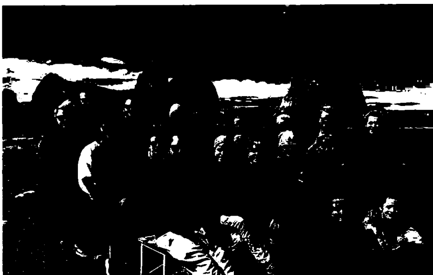
Årsmelding for Stiftelsen Grenland Folkehøgskole 2023

GRØNLAND FOLKEHØGSKOLE VED KYSTEN AV TELEMARK