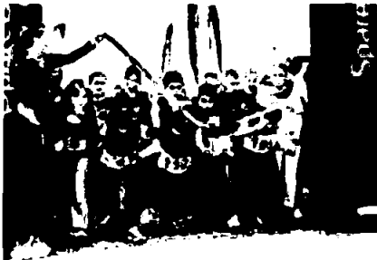
Utdrag fra St. Pets årsrapport 2024. Markeds og Kommunikasjonsavdelingen yter bistand i arbeidet med bidrag til allmenntilretteleggende tiltak.