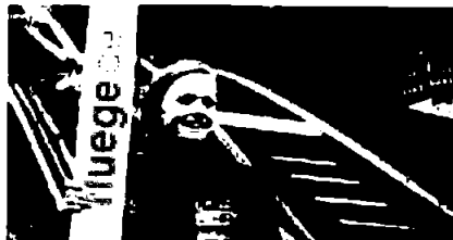
En ung person mottar stipend fra Gavestiftelsen. Stipendet er etablert for å støtte talentfulle unge på Helgeland.

Fra 2023 ble disse stipendene endret til å inngå i ordningen « Helgelandsambassadører ».