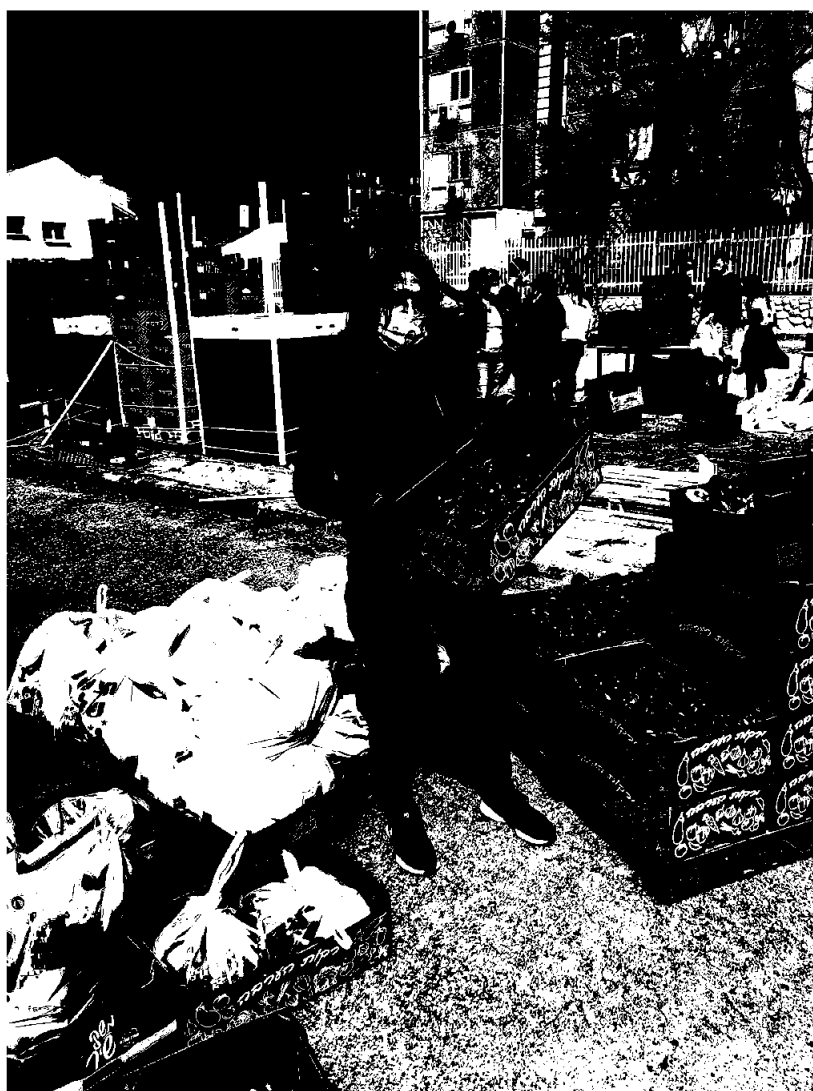
En av de mange frivillige som har hjulpet Meitarim i distribusjon av mat under corona-epidemien

HJH har i 2020 støttet prosjekter som arbeider forskjellige steder, bl.a. Israel, Etiopia, Ukraina og Russland. 27 prosjekter fikk innvilget støtte, derav fem gjennom Keren Hayesod. Alle prosjektene har fått oversendt hele støtten som ble bevilget på styremøte 31. mars. I tillegg har alle prosjektene fått oversendt en større tilleggsbevilgning etter samme fordelingsnøkkel, besluttet i styremøte 8. desember. I tillegg til de 27 prosjektene kommer Fadderbarnprosjektet og øremerkede gaver.