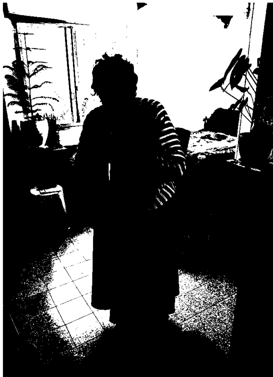
En eldre holocaust-overlevende takker HJH for støtte under corona-epidemien.

MVA-refusjon som vi mottok i 2020 for 2019 var kr 642.460. Mottatt i 2019 for 2018, var kr. 765.406. Mottatt i 2018 for 2017 var kr. 780.316.. Avkortningen av mva-kompensasjonen i forhold til søkt beløp er på 19,016 %. I år ble avkortningen økt i forhold til tidligere år. HJH søkte opprinnelig om kr 793.321. HJH er medlem av Frivillighet Norge som blant annet arbeider for at denne posten på statsbudsjettet skal bli økt, slik at den dekker 100% av tjenestemomsen, og at det ikke blir noen avkortning.