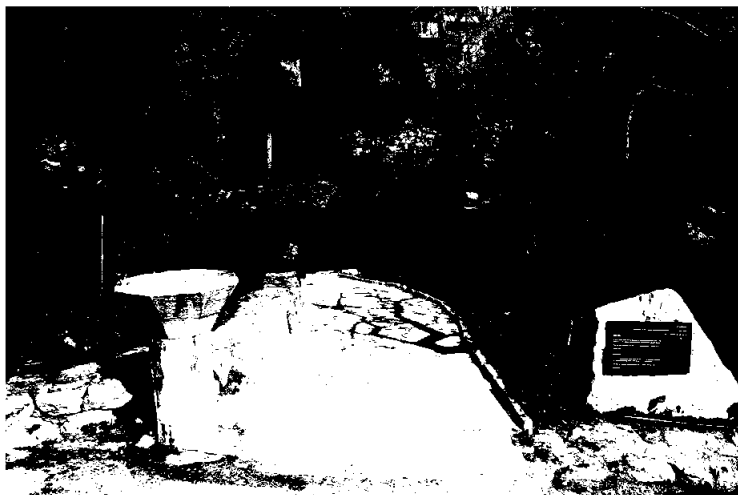
Eikestien: HJHs minneste i Jerusalems botaniske hage.

HJH har i samarbeid med Botanical Garden i Jerusalem utviklet et minneste, Eikestien. Dette ligger i den del av den botaniske hagen som er viet plantelivet i Israel i bibelsk tid. Givere som gir mer enn kr 100.000 i løpet av ett år, blir gitt tilbud om å få sitt navn og bosted på en minneste i Eikestien. Dette er et evig minne om deres generøsitet og en takk fra HJH, samtidig som det er en mulighet for giverne til å ha sitt sted i Jerusalem. For noen givere er dette også en mulighet for å forevige sine kjæres navn i Jerusalem.