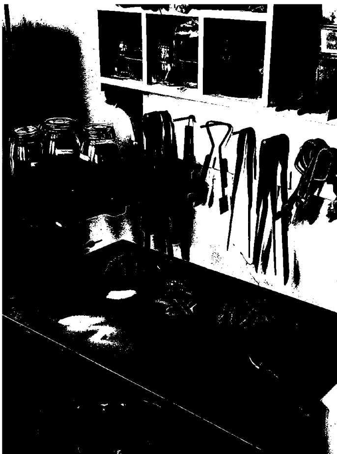
Fra skolens glasshytte, -et verneverdige tradisjonshåndverkfag på Unescos liste over immateriell kulturarv