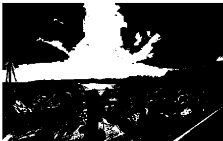
Første skoledag i nytt skoleår – her nytes lunsjen og vi blir kjent med de nye studentene

Kragerø Kunstscole har stor betydning for byen gjennom å trekke til seg unge mennesker, med deres nettverk, til å studere, bo og leve i byen. Tidligere studenter vender stadig tilbake til byen og fagmiljøet ved skolen.