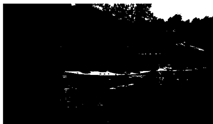
Kajakkurs og ekskursjon på Ørvik ved studiestart