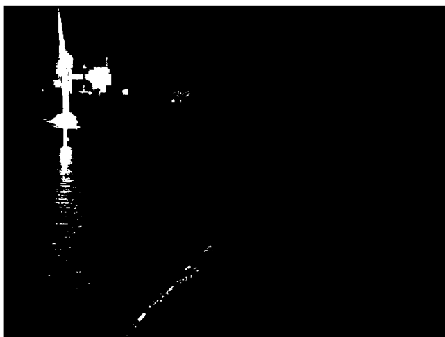
Båttur for de ansatte etter to planleggingsdager før skolestart i august

KKS er medlem av Vestmar Bedriftshelsetjeneste. Ansatte har pensjonsordning på 3% i tillegg til de 2% som er lovpålagte. Bedriften har til sammen 2,7 årsverk. Det er fem ansatte, hvorav fire kvinner og en mann. Sykefravær i 2023 var på 1,3%. Skolen har i tillegg til ansatte engasjert mange høyt utdannede og profilerte kunstnere som gjestelærere fra inn- og utland gjennom året. Kragerø Kunsthøgskole AS forurensrer ikke det ytre miljø.