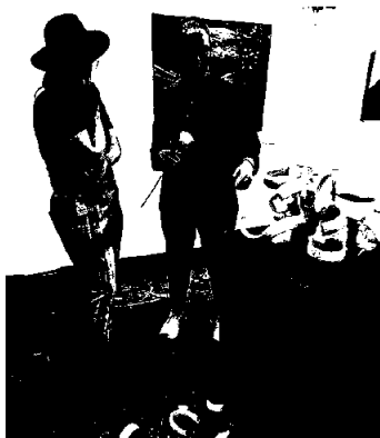
Fra avgangsutstillingen- mange fine observasjoner og refleksjoner

Skolens totale driftsinntekter i 2023 var på kr 5 134 989. Studentbetalingen var på kr 1 136 143. Utbetalingen fra staten var på kr 3 997 846. Regnskapet for 2023 viser et årsresultat på kr 275 028. Årsresultatet skyldes i hovedsak lavere strømkostnader enn året før. Nedgangen fra 75% til 65% i dekning pr. student fra Udir hadde halvårsvirkning i 2023 mens endringen vil få helårseffekt neste år. Styrets ambisjon er å sikre skolen nødvendig med en økonomisk buffer til å ivareta kontrakten med studentene.