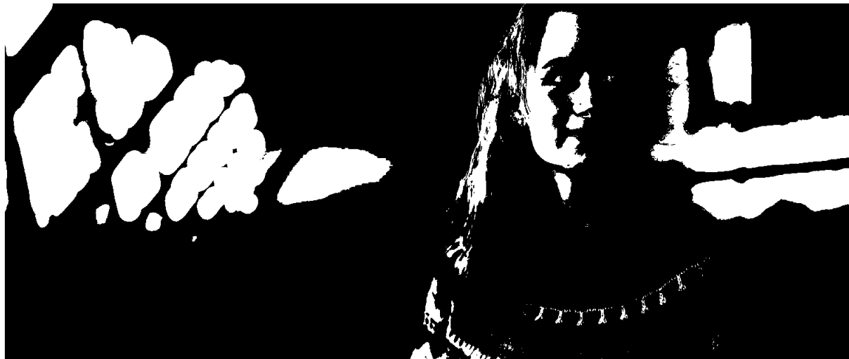
Kundene våre er opptatt av å sikre sine verdier