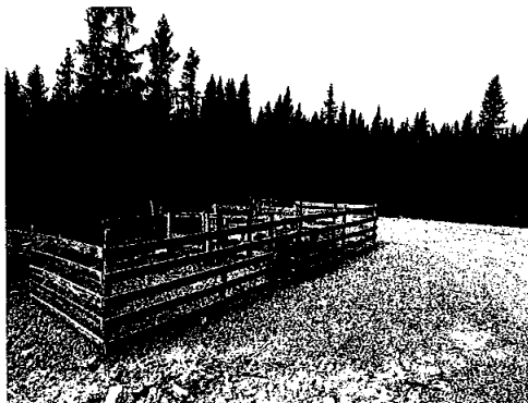
Ny sau binge i 2021 på Tømmertåjet

Det var godt beite i almenningen og ingen kjente rovdyrproblemer i beitesesongen. Det ble registrert tap av 185 sau og 1 storfe.