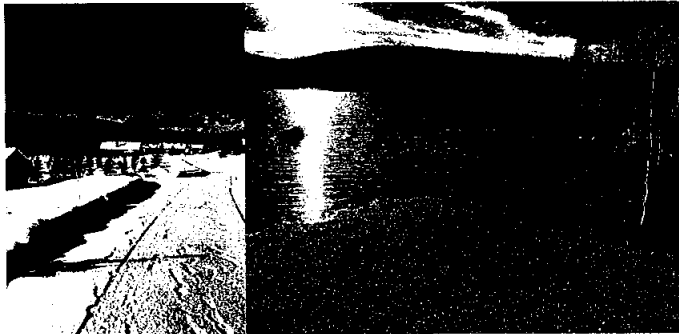
Svartungen hyttefelt har kun 1 tomt ledig.

På lodd nr 2 er det 195 hytter med festetomt. Det ble i 2017 bygd et nytt hyttefelt ved Svartungen hvor det ble tilrettelagt for 25 festetomter. Det ble bortfestet 6 tomter i 2021. Til sammen er det festet bort 22 tomter per 31.12.21. Det har vært svært stor interesse for feltet også i 2021. I skrivende stund er det kun en tomt igjen på feltet.