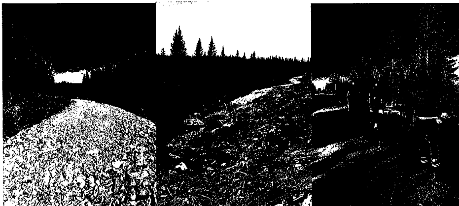
Vegen ble ferdigstilt i 2021, en investering som vil gagne almenningens forvaltning i fremtiden.

Arbeidet på vegen mellom Storbrenna og Vollum er fullført. Det er påkjørt vegmasser på 4 av 7 km, og arbeidet vil bli ferdigstilt i 2022. Det er innvilget tilskudd på vegen. Det er ellers gjort stedvis utbedringer og vedlikehold av det øvrige skogsbilvegnettet.