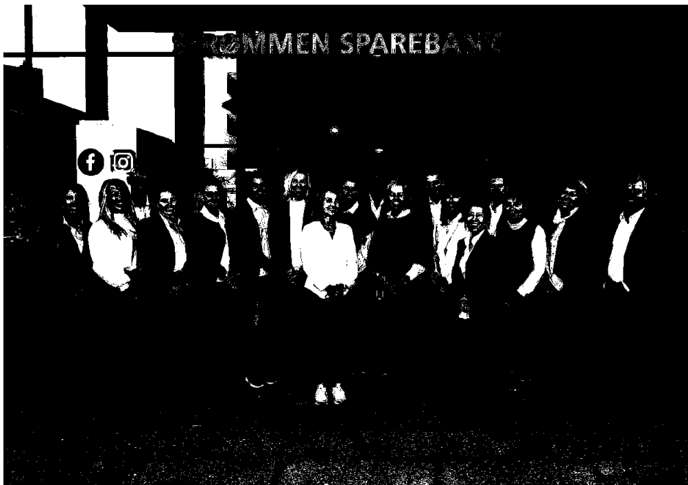
Bankens ansatte gjennom 2023

Styret takker de ansatte for en god innsats gjennom året.